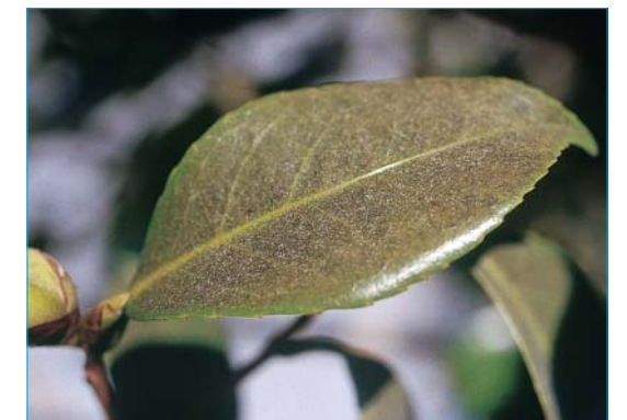
Adulto y daños de Calacarus carinatus