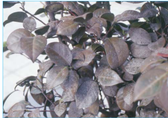
Rama afectada por un fuerte ataque de araña roja

la observación directa de las colonias, y su cuantificación mediante un muestreo sistemático o secuencial. Si el nivel poblacional lo justifica, se debe intervenir, bien recurriendo a la lucha química (con acaricidas específicos) o a la lucha biológica, mediante la suelta de ácaros beneficiosos fitoseidos; sobre la camelia no se conocen experiencias en este sentido pero sobre otras plantas existen numerosas referencias de sueltas de Phytoseiulus persimilis , depredador específico de Tetranychus urticae , que posee una elevada capacidad de predación (en período de puesta, la hembra es capaz de consumir hasta 15 adultos del fitófago y unos 8 huevos) y un ciclo biológico más rápido que el de su presa.