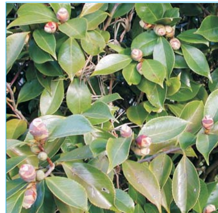
Daños en capullos