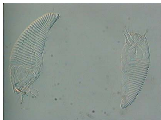
Acaphylla al microscopio

La puesta en práctica de la lucha contra este ácaro, que debe realizarse con acaricidas específicos, debe ir precedida de la confirmación de la presencia del mismo.