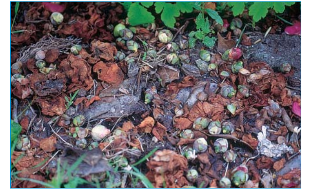
Síntomas y daños del ataque de Cosetacus camelliae

En la actualidad, el único método de control que puede resultar efectivo en la lucha contra este ácaro es la realización de tratamientos químicos. El primer tratamiento se debe realizar después de la floración, cuando las yemas comiencen a hincharse y se inicie la elongación de los nuevos brotes de crecimiento anual (primavera); después deben realizarse nuevas aplicaciones tras la elongación de los brotes, cuando las hojas empiezan a extenderse, e incluso cuando los nuevos capullos se empiezan a ver (verano). Además, los capullos afectados que cubren el suelo deben ser retirados y destruidos para disminuir la población nociva.