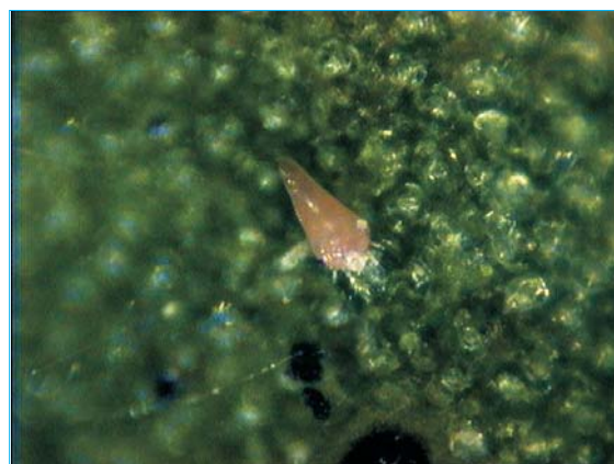
Acaphylla steinwedeni Keifer