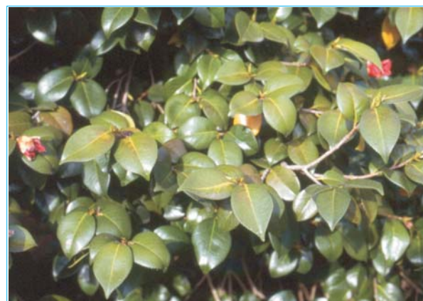
Daños de Acaphylla